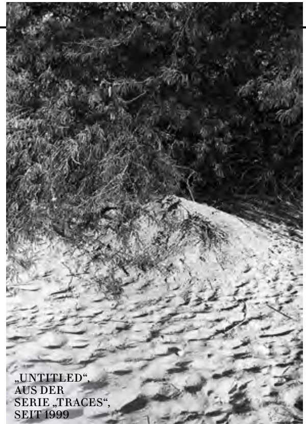
„UNTITLED“, AUS DER SERIE „TRACES“, SEIT 1999

Zilberman Galerie HEBA Y. AMIN _bis 2. November (Goethestr. 82) zilbermangallery.com